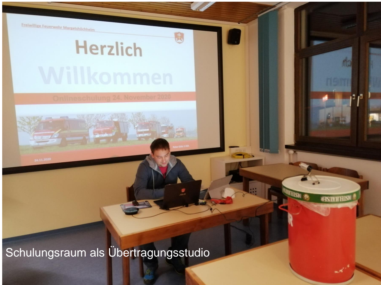
Schulungsraum als Übertragungsstudio